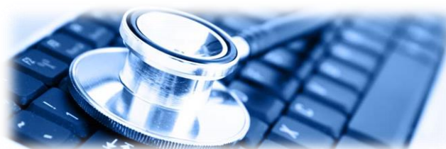
MEDICINA DEL LAVORO

MEDICINA DEL LAVORO ELETTROCARDIOGRAMMA, SPIROMETRIA, AUDIOMETRIA, ESAMI EMATICI